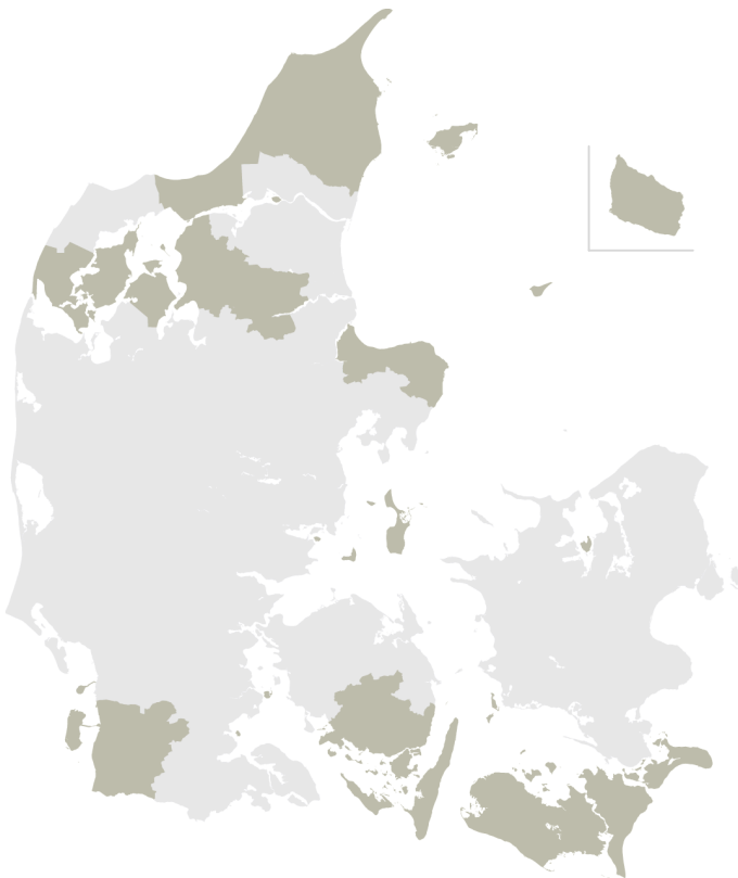
Yderområder og overgangsområder i forhold til EU's strukturfondsmidler og det forhøjede befordringsfradrag.

I forbindelse med strukturfondsindsatsen 2007-2013 er 16 kommuner defineret som yderområder på baggrund af to samfundsøkonomiske indikatorer: lav erhvervsindkomst og svag befolkningsudvikling. Herudover er de 27 småøer under Sammenslutningen af Danske Småøer udpeget som yderområder. Endelig er der udpeget nogle såkaldte overgangsområder. Det er Mål